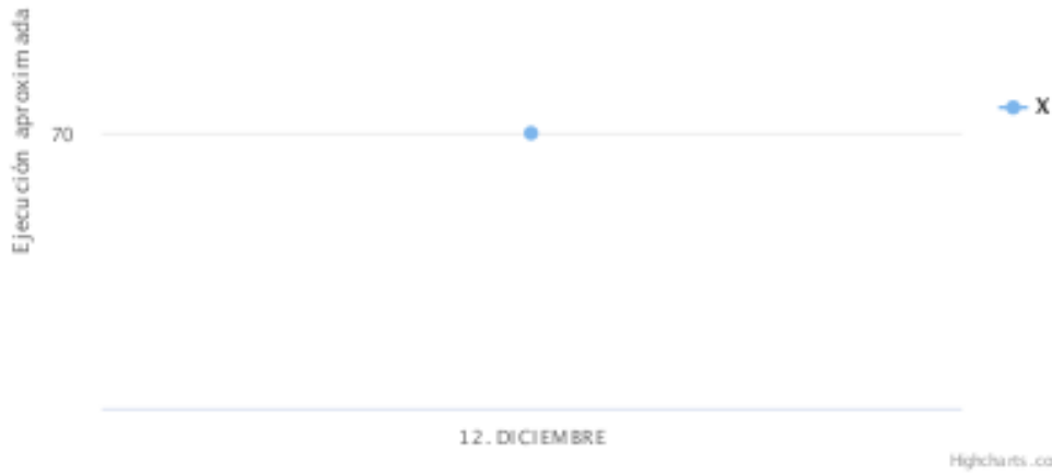
Suscripción PMP 2022